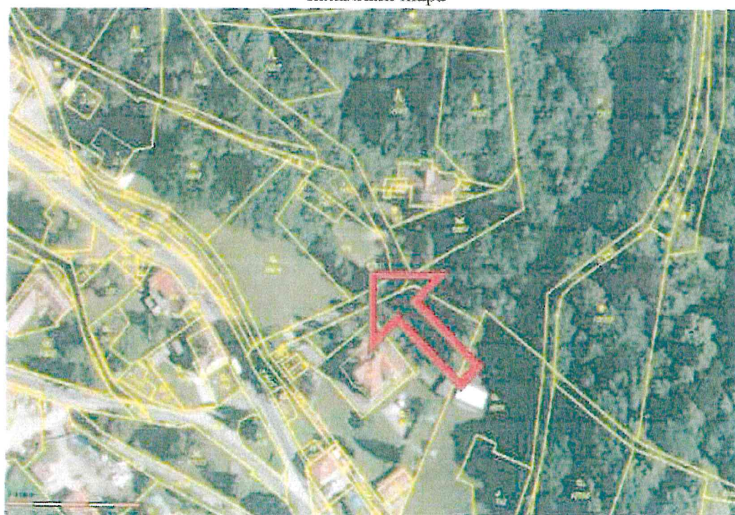
ortofoto katastrální mapa