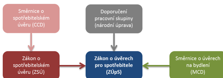
Schéma: Legislativní technika nové právní úpravy distribuce úvěrů

Konzultační materiál se soustřeďuje na několik vybraných oblastí regulace, které MF považuje za klíčové: