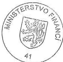
Mgr. Ondřej Landa náměstek ministra

se v uvedeném rozhodnutí o privatizaci ruší podmínky privatizace, na základě kterých měla být veřejná soutěž realizována Státním pozemkovým úřadem. Veřejná soutěž bude realizována Ministerstvem financí a dále se v uvedeném rozhodnutí nahrazuje text „Vyhlašovaná cena /minimální/: 505 524,- Kč“ textem „Vyhlašovaná cena orientační: 505 524,- Kč“.