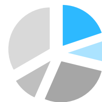
Tabulka 1 - Struktura výdajů resortů (vzorek 6 resortů)

Komoditní kategorie, které lze na základě jejich poměrně snadné standardizovatelnosti a zkušeností ze zahraničí považovat za vhodné pro centrální nákup, se na celkových nákupních výdajích podílejí 20 % (užší pojetí), resp. 29 % (širší pojetí).