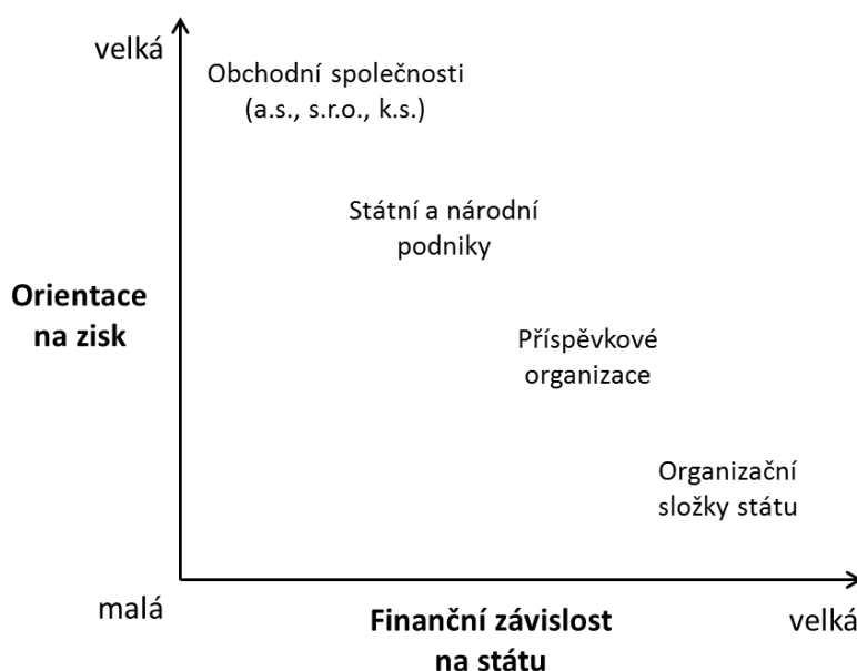
Obrázek 2: Přehled právních forem společností, podniků a organizací ve vlastnictví státu, jejich hlavní úkoly a vazba na stát

Obrázek 2 shrnuje výše popsaná specifika jednotlivých právních forem společností, podniků a organizací ve vlastnictví státu. Je důležité zajistit, aby právní forma vždy reflektovala cíle daného subjektu. Akciové společnosti by měly fungovat na tržním principu a měly by být finančně v maximální možné míře nezávislé na vlastníkově. Pro tyto společnosti by měl stát na úrovni vlastníka zejména definovat strategii a cíle a současně odpovědně vykonávat svá akcionářská práva. Naopak příspěvkové organizace a organizační složky státu mají plnit veřejné služby i za předpokladu ztráty. Vzhledem k tomu, že tyto státní instituce jsou přímo finančně závislé na státu, je nutná jejich zvýšená kontrola a stát má daleko vyšší pravomoci zasahovat do jejich chodu (a také jiné kontrolní mechanismy), než je tomu v případě obchodních společností.