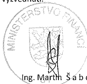
Ing. Martin Š a b o zástupce ředitele odboru Procesní agendy a regulace hazardu

Proti tomuto rozhodnutí lze v rozsahu, který se týká předmětu této změny, u ministerstva podat rozklad podle ustanovení § 152 odst. 1 správního řádu, a to ve lhůtě 15 dnů ode dne oznámení rozhodnutí. O rozkladu rozhoduje ministr financí na základě návrhu rozkladové komise. Včas podaný rozklad má podle ustanovení § 152 odst. 4 správního řádu ve spojení s ustanovením § 85 odst. 1 správního řádu odkladný účinek. Lhůta pro podání rozkladu se počítá ode dne následujícího po doručení písemného vyhotovení rozhodnutí, nejpozději po uplynutí desátého dne ode dne, kdy bylo nedoručené a uložené rozhodnutí připraveno k vyzvednutí.