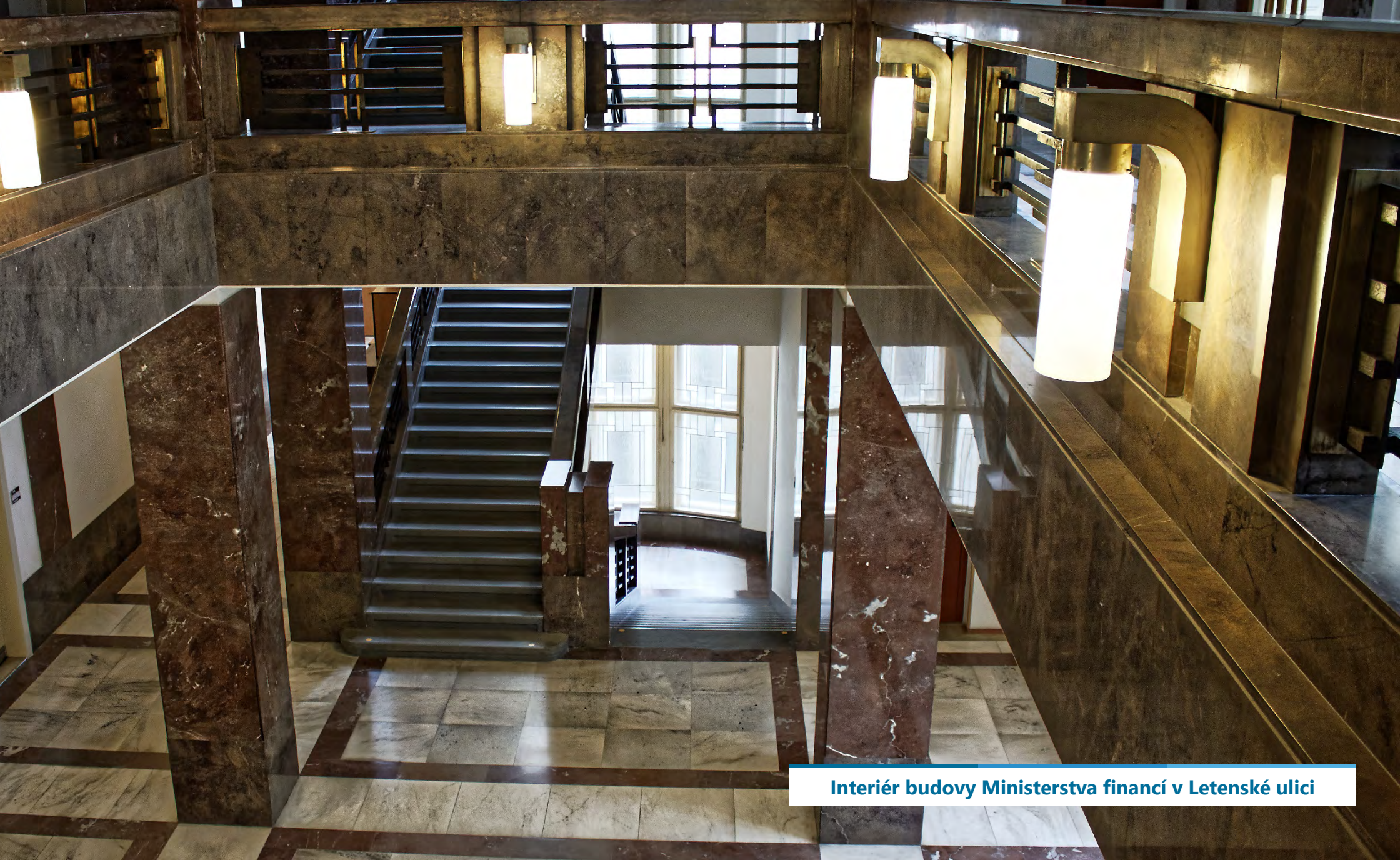
Interiér budovy Ministerstva financií v Letenskej ulici