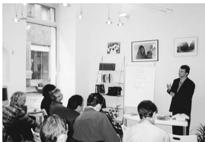
Školení v rámci projektu Hlídky práv občana spotřebitele