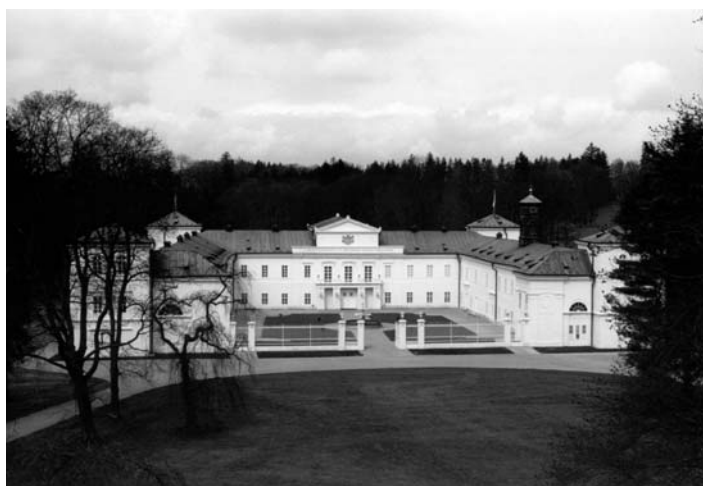
Zrekonstruovaný zámek Kynžvart

Až do r. 1976 patřil zámek k nejnavštěvovanějším v České republice. V letech 1976–1994 byl uzavřen a kompletně vystěhován z důvodu dlouholeté rekonstrukce vyvolané rozšířením dřevomorky v objektu. Od r. 1994 byl částečně zpřístupněn, ale finanční prostředky Památkového ústavu ze státního rozpočtu nestačily na dokončení obnovy této unikátní historické památky. Evropská unie tedy poskytla asi 34,5 mil. Kč převážně na restaurátorské práce a práce spojené se sanací zámku a 7,8 mil. Kč na opravu exteriéru zámku. Uvedení zámku Kynžvart do provozu má rozhodující význam pro rozvoj turistiky v regionu. Optimální poloha areálu uprostřed západočeských