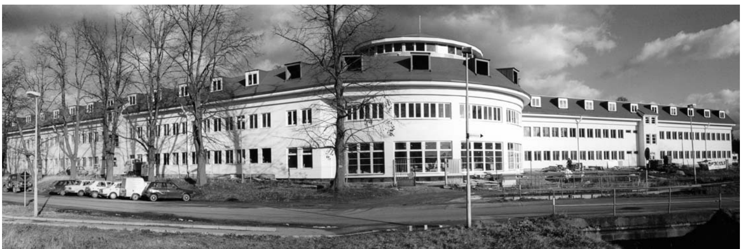
Justiční akademie ve Stráži pod Ralskem

Cílem projektu bylo pomoci Státní rostlinolékařské správě při implementaci části acquis communautaire v následujících oblastech: rostlinolékařská inspekce ve vstupních místech a v místech produkce rostlin a rostlinných produktů, registrační systém výrobců a obchodníků, rostlinných pasů, monitoringu škodlivých organismů a zřizování chráněných zón, které jsou bez výskytu určitých karanténních organismů. V průběhu projektu byly uspořádány semináře ke všem vyjmenovaným tematickým okruhům, kterých se zúčastnila