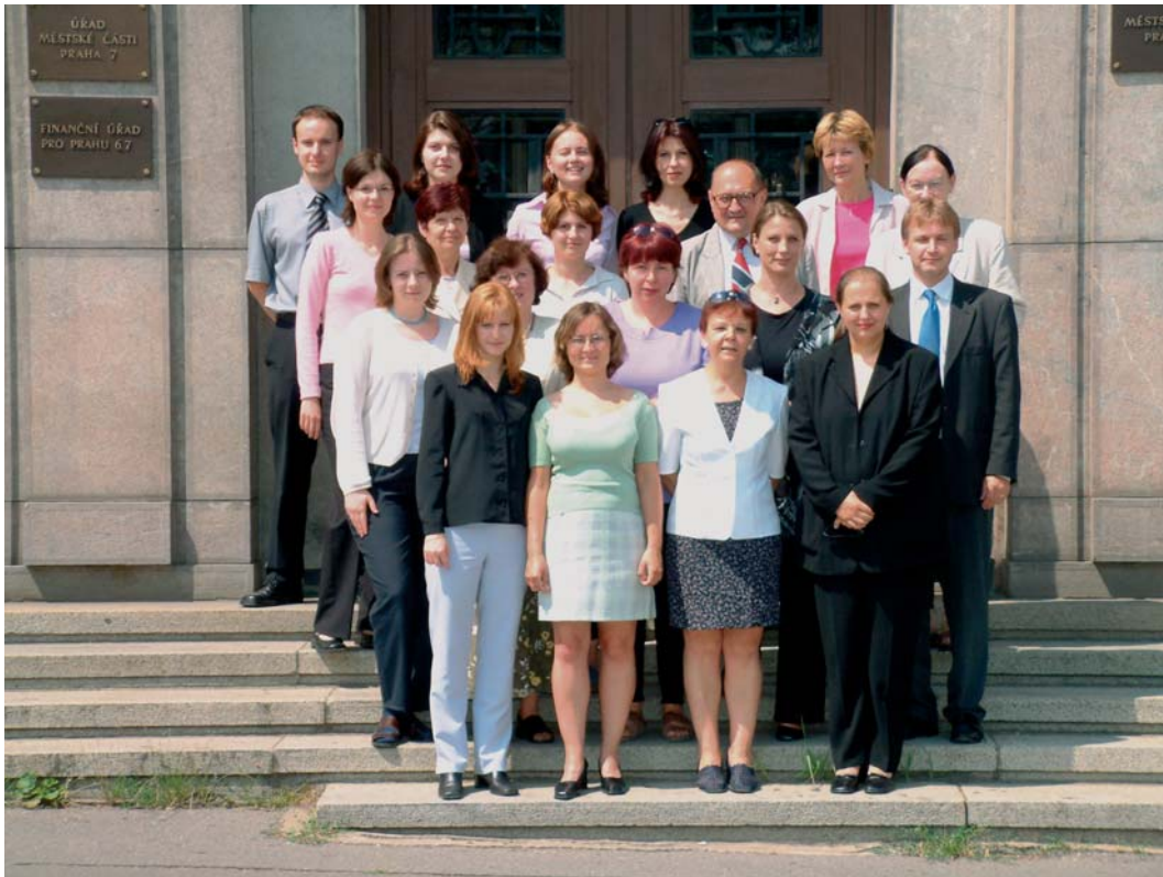
Centrum pro zahraniční pomoc