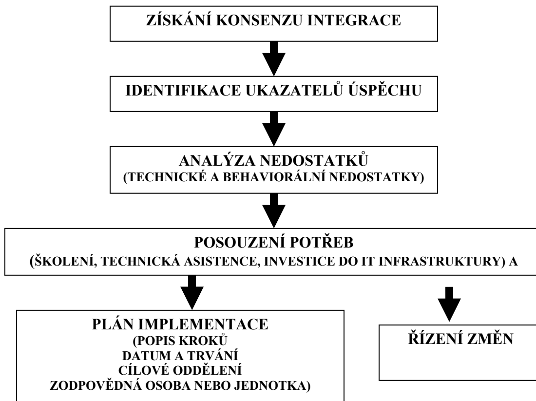
Graf 1. Přípravné kroky

6.6 Bez ohledu na vládní model je silný a udržitelný politický závazek velice důležitý při vytváření a vedení profesionální a účinné správy příjmů. Vláda musí určit nástroje a strategie, které nejlépe odpovídají motivu, který za integrací stojí. Pro vybudování těchto nástrojů a strategií možná bude zapotřebí využít profesionální pomoci.